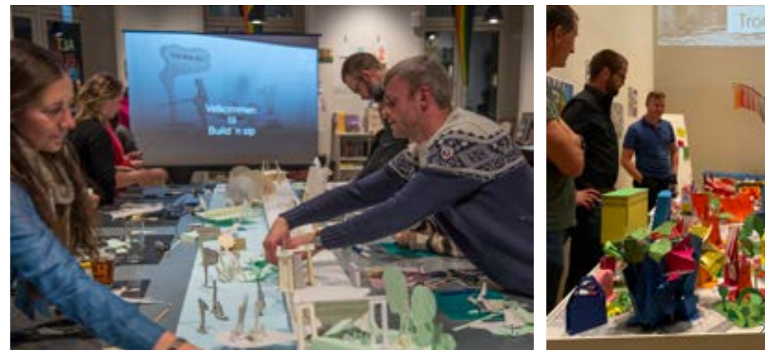
>> 1, 2. Build'n sip- Fotograf: NODA