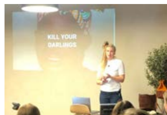
>> Morrakaffe: Produktdesign: Tromsø