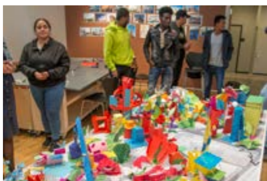
>> Tromsøs fremtid: Sommerskole