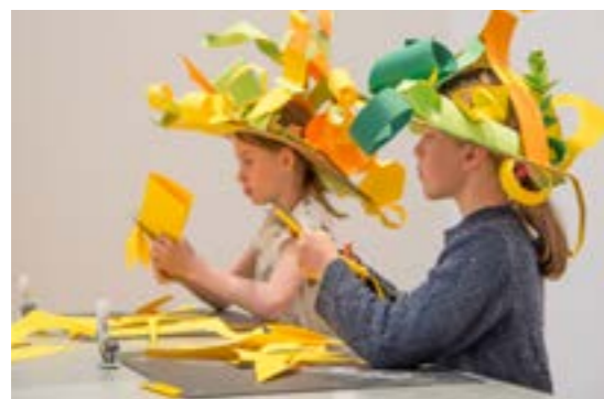
>> Arkitekturhatter: Sommerskole - Fotograf NODA