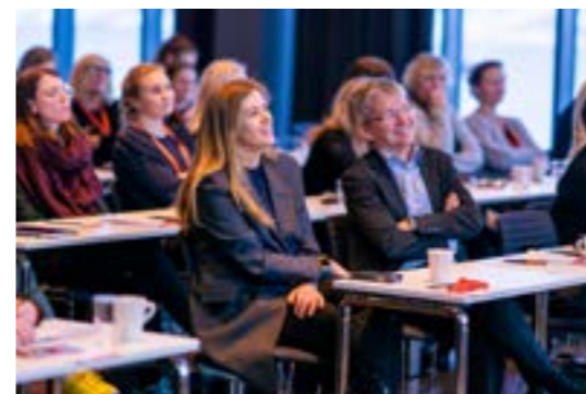
>> Tjenstedesignkonferanse: Bodø