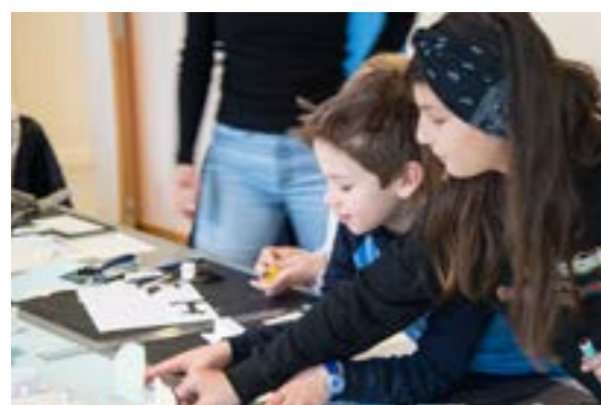
>> Kaipromenade: Høstskole - Fotograf NODA