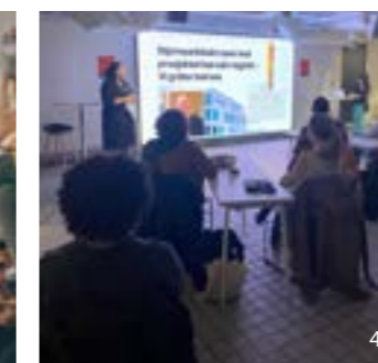
>> 3,4. BarePrat