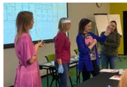
>> Workshop: farger i interiøret: Alta