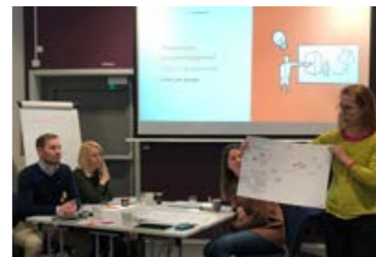
>> Workshop: introduksjon til tjenstedesign, Hammerfest