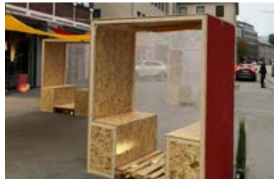
>> Fortausfest: Sentrum, Bodø