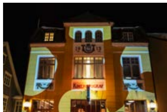
>> DARK festival Tromsø