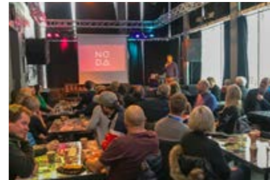
>> Frokostseminar: Alta

> UIT inviterte oss til å levere faglig innhold til etterutdanningstilbud for Lofoten kommuner. Vi leverte foredrag og workshops til deres 5 samlinger på Svolve