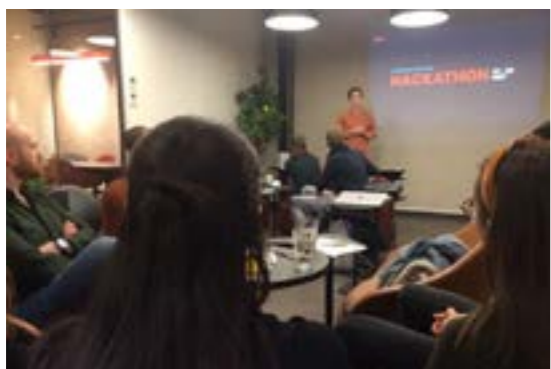
>> Hackaton, Tromsø