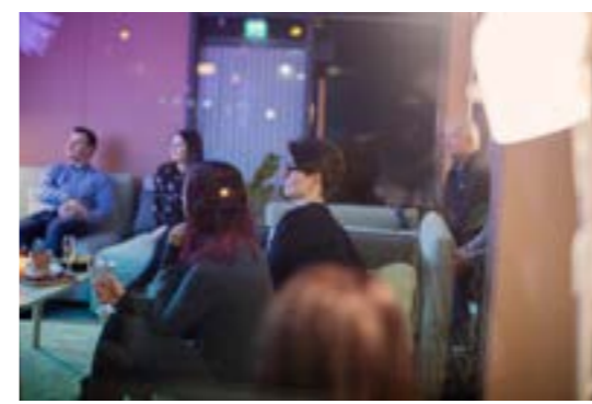
>> Bransjetreff: Alta