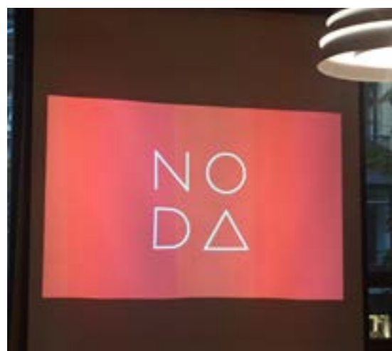
>> Presentasjon av NODA for Troms politikere

> Sammen med cirka 60 andre regionale aktører var NODA med å gi innspill til et felles kunnskapsgrunnlag om vekst og verdiskaping i Nord-Norge. Dette skal være grunnlaget for en ny stortingsmelding. Der ber vi om at følgende blir hørt og anerkjent: