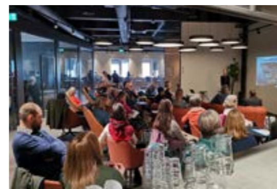
>> Workshop: Tromsø sentrum Anno 2032