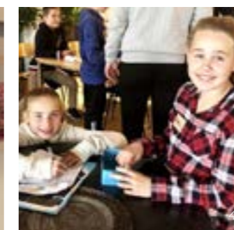
>> 1. Workshop Bakgård - Fotograf: NODA 2. Kodekurs - Fotograf: NODA 3. 4. Emballasjedesign - Fotograf: NODA