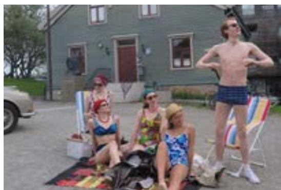
>> Bakgårdsfest, Uterom - Skansen, Tromsø