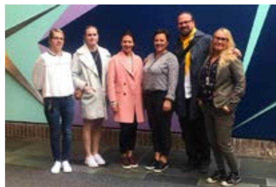
>> Presentasjon av NODA for Finnmarksbenken