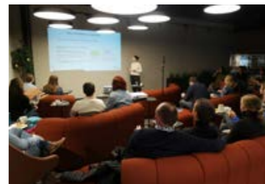
>> Morrakaffe: Aktive Hus