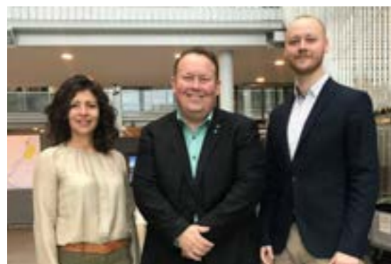
>> Presentasjon av NODA for Tromsbenken