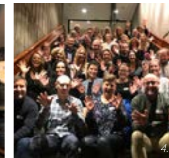
>> 1. Tjenstedesign prosjektgruppe - fotograf: NODA 2. Metodelære tjenstedesign - Fotograf: NODA 3., prosjektdeltakere i arbeid - Fotograf: NODA 4. Prosjektdeltakere, 10 designere 10 bedrifter- fotograf: Arctic Forum