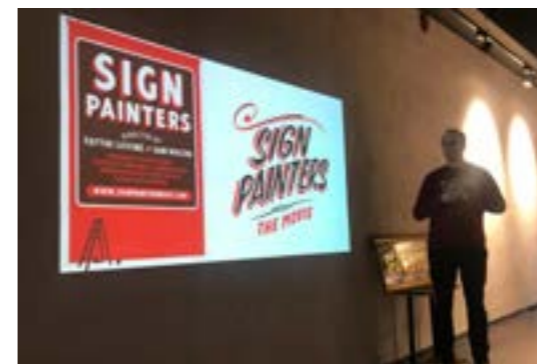
>> Påfyll: Skiltdesign

> Bakgårdsfest: I år hadde vi to bakgårdsprosjektet. Bodø og Tromsø. Begge viste mulighetene som finnes i disse skulte rommene. I Tromsø samarbeidet vi med Flip Creative Studio, Tromsø Polarmuseum, Gamlebyen Skansen, Tromsø Kommune, Perspektivet Museum, Universitet i Tromsø, Vervet, Fontenehuset Tromsø, Ecma HHT, Nina Erdahl Casting & Costumes og Polarmuseet samt bakgårdsfesten i Bodø med Kulturatta. Resultatet ble to spennende arrangementer som viste hvordan et nedslitt og oversett uterom kan bli til en magisk arena for kultur ved hjelp av design og arkitektur.