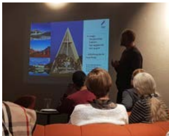
>> Relansering av arkitekturguiden