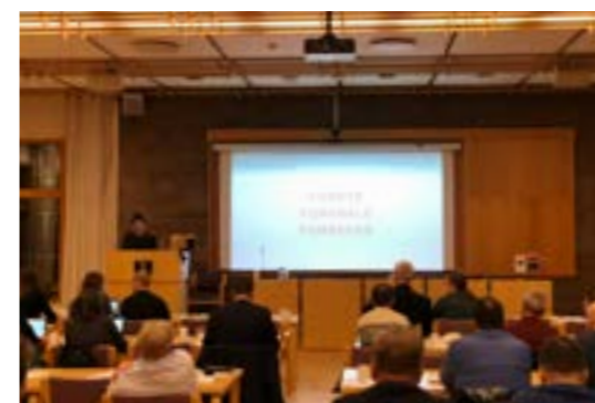
>> Foredrag: Tjenestedesign