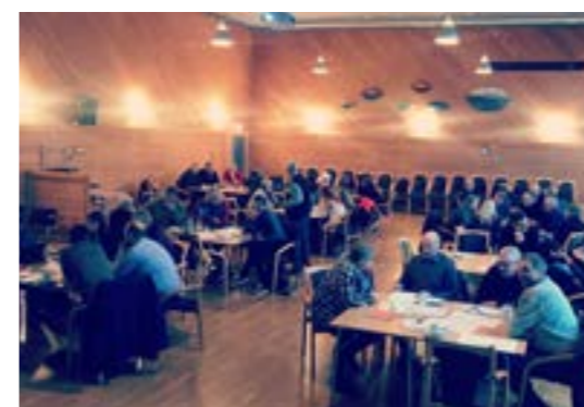
>> Workshop: Stedsutvikling