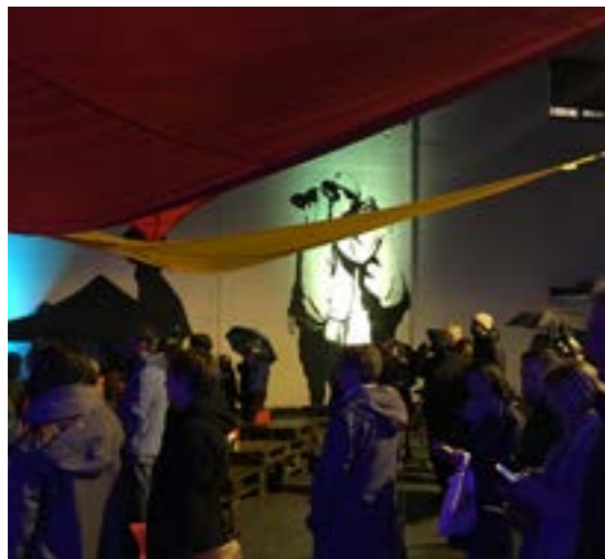
>> Bakgårdsfest Englebakgården, Bodø