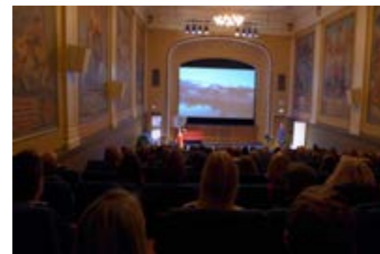
>> Seminar: Interiørarkitektur og møbeldesign