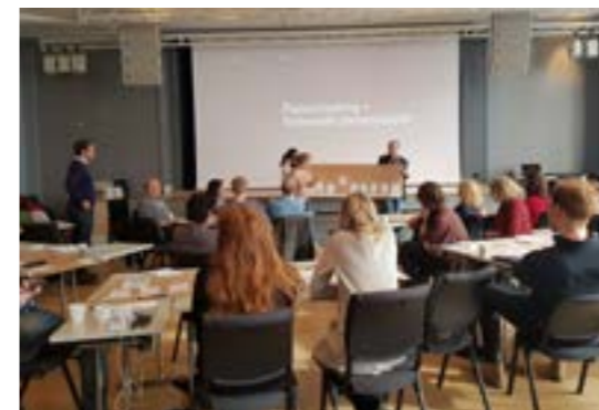
>> Workshop tjenestedesign for reiselivsnæring