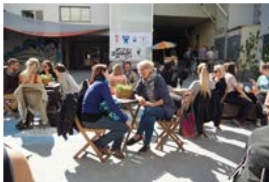
>> Bakgårdsfest, Mackkvartalet, Tromsø