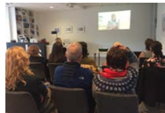
>> Påfyll: Hvorfor design