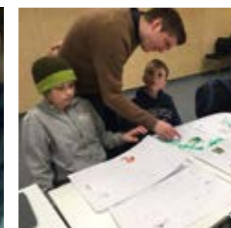
>> 1. Sommerkurs- Fotograf: NODA 2.3 DKS - Fotograf: NODA 4. UKM Tromsø, Andenes - Fotograf: NODA