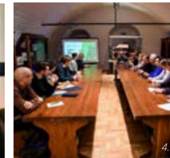
>> 1. NODa delegasjon- Fotograf: NODA - fotograf: NODA 2. Prosjektledere fra hvert land - Fotograf: Arctic Forum 3., Presentasjon av Grafill Fotograf: NODA 4. Møte med ordfører og byadministrasjon- fotograf: Arctic Forum