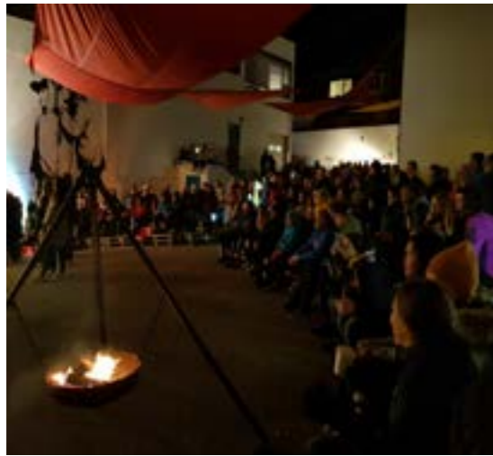
>> Bakgårdsfest Englebakgården, Bodø