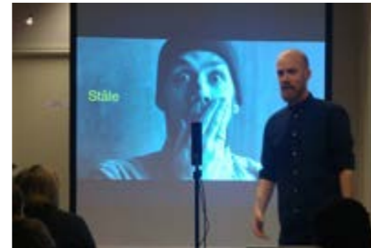
>> Morrakaffe: Grafiskdesign og kommunikasjon

> Bakgårdsfest: I år hadde vi to bakgårdsprosjektet. Bodø og Tromsø. Begge viste mulighetene som finnes i disse skulte rommene. I Tromsø samarbeidet vi med Tromsø Academy of Landscape and Territorial Studies og i Bodø med Kulturatta. Resultatet ble to spennende arrangementer som viste hvordan et nedslitt og oversett uterom kan bli til en magisk arena for kultur ved hjelp av design og arkitektur.