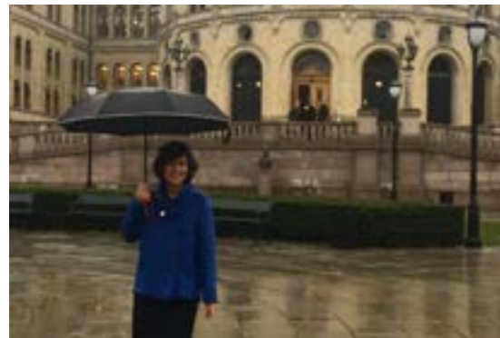
>> Presentasjon av NODA for Nordlandsbenken