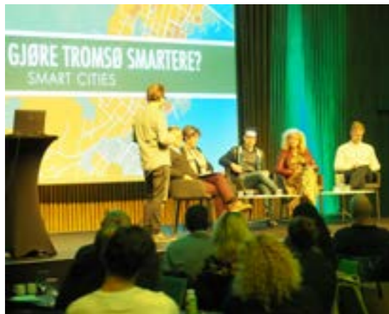
>> Byutviklingskveld: Er Tromsø en smart by?