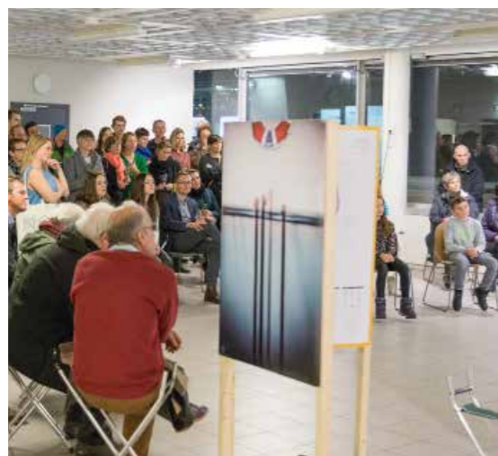
>> Plakatutstilling - Fotograf: Kristina Schröder