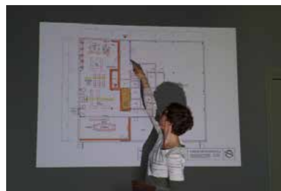
>> Morrakaffe: Interiørarkitektur