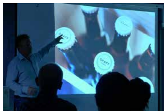
>> Morrakaffe: Visuell kommunikasjon – Fotograf: NODA