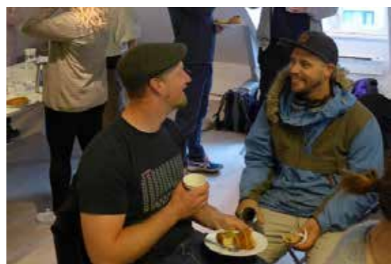
>> Morrakaffe: Visuell kommunikasjon