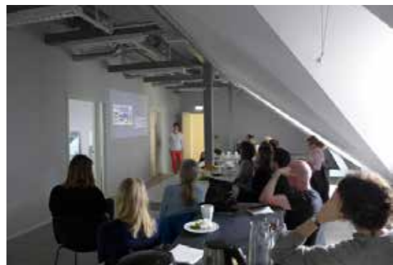
>> Morrakaffe: Interiørarkitektur