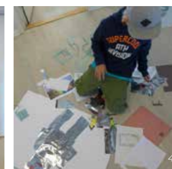
>> 1. UKM arkitektur 2. UKM design 3.,4. Sommer workshop