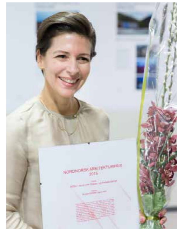
>> Nordnorsk Arkitekturpris

NODA mottok årets nordnorsk arkitekturpris 29. oktober 2015. Nordnorsk arkitekturpris deles ut årlig til prosjekter med spesiell referanse til, og av betydning for nordnorsk historie, kultur og omgivelser.