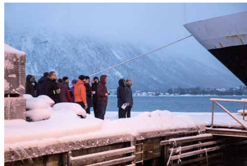
>> Industrisafari - Fotograf: Kristina Schröder